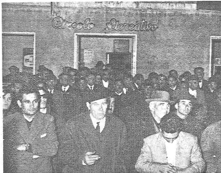
I compagni e i lavoratori pisani al comizio di Pontasserchio per la celebrazione del 7 novembre