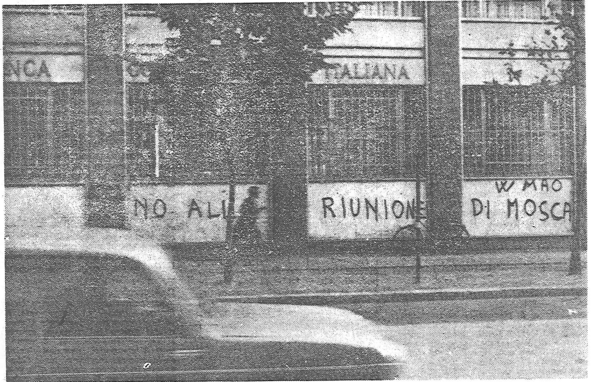
Nell'ex Stalingrado italiana (Sesto S. Giovanni) i leghisti partecipano, con affissione di manifesti davanti alle fabbriche e scritte murali, alla campagna dei marxisti-leninisti contro la riunione scissionistica di Mosca

I comunisti e i lavoratori avevano creduto che la posizione presa alcuni mesi fa dal Comitato Centrale fosse intesa a facilitare la composizione delle divergenze sorte in seno al movimento comunista internazionale ed a salvaguardarne l'unità. Oggi invece sono costretti a constatare che i dirigenti del