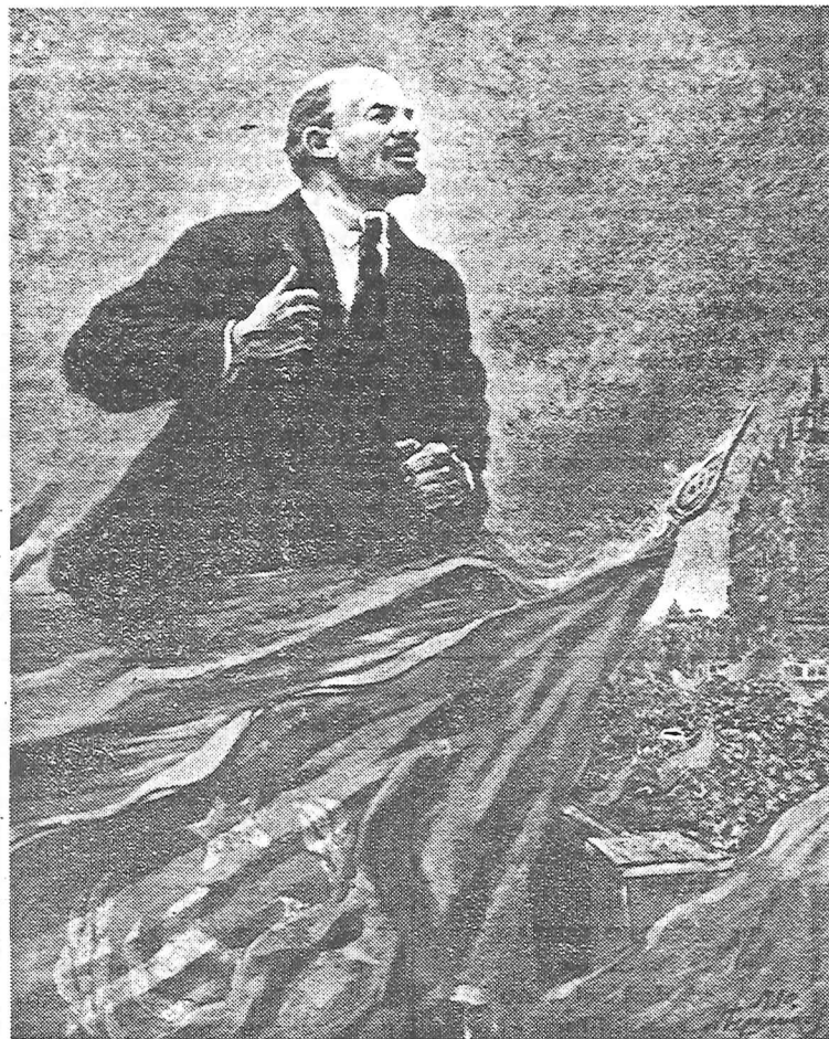
Lenin alla tribuna (quadro del pittore Gherassimov)

luzione d'Ottobre. Nella rete mondiale imperialista, essa ha aperto una falla che si è andata prodigiosamente allargando e che si dilata con un ritmo di accelerazione storica e una acutizzazione su scala mondiale della lotta di classe impensabile ancora nel secolo scorso, e del tutto estranea alle precedenti epoche dell'umanità. Dall'Istituto Smolny, mente e cuore della Pietrogrado proletaria, essa ha segnato gli inizi di un'ondata rivoluzionaria che in pochi decenni ha emancipato dalle vecchie catene del feudalesimo, del colonialismo, dell'imperialismo, più di un terzo dell'umanità; ogni suo balzo in avanti fa scricchiolare le putride impalcature imperialiste e crea in tutti i paesi, compreso il nostro, delle condizioni sempre più favorevoli per sviluppare e portare fino in fondo le loro rivoluzioni. Questa rossa ondata non potrà acquietarsi sinché non avrà spazzato via per sempre una « civiltà » che,