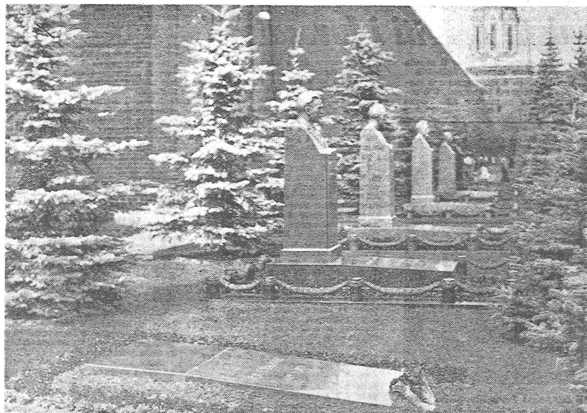
I rivoluzionari non dimenticano i rivoluzionari: sulla nuda tomba di Stalin un compagno italiano ha depresso un mazzo di fiori rossi

L'attività ostile di Nikita Krusciov è molto vasta. Le radici del suo tradimento sono profonde ed impregnate di conseguenze fatali per i destini del socialismo e della rivoluzione. Perciò i marxisti-leninisti rivoluzionari pur considerando la vergognosa fine di Nikita Krusciov e la sua scomparsa dalla scena politica, una importantissima vittoria sul revisionismo moderno, una testimonianza del fallimento della linea politica ed ideologica del moderno re-