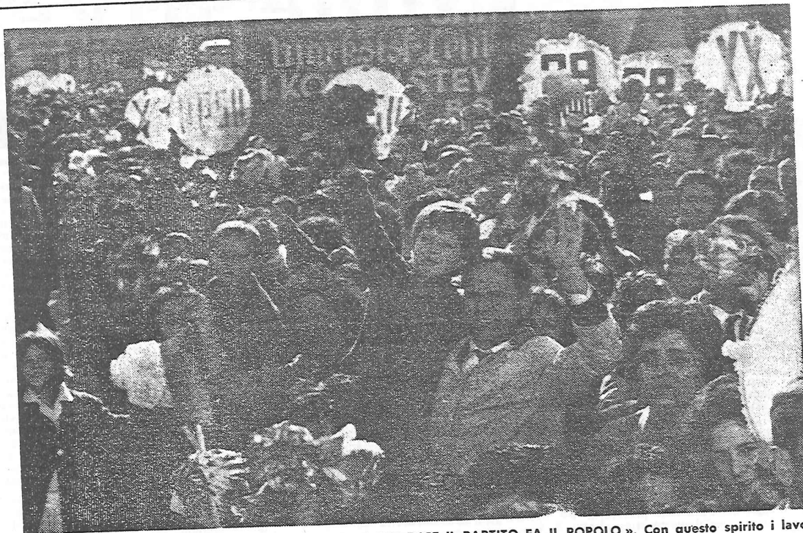
« CIO' CHE VUOLE IL POPOLO FA IL PARTITO - CIO' CHE DICE IL PARTITO FA IL POPOLO ». Con questo spirito i lavoratori albanesi festeggiano il XX anniversario della loro liberazione.

Nei giorni 28 e 29 novembre, a Tirana e negli altri centri della Repubblica Popolare di Albania, hanno avuto luogo le celebrazioni del XX Anniversario della Liberazione dell'Albania dall'oppressione nazi-fascista. Fu infatti il 29 novembre 1944 che il popolo albanese, diretto dal Partito Comunista d'Albania, (poi Partito del Lavoro) a conclusione di una cruenta guerra di liberazione, nel corso della quale caddero 28 mila partigiani albanesi, cacciò dall'Albania i resti dell'esercito nazista che per cinque anni aveva insanguinato l'Europa. A venti anni di distanza il popolo della Repubblica Popolare ha celebrato i propri successi conseguiti nell'opera di costruzione del socialismo: l'industrializzazione del paese, la collettivizzazione dell'agricoltura e lo sviluppo, su basi socialiste, della cultura e della organizzazione scolastica, assistenziale, mutualistica ecc. Gli italiani che venti anni fa conobbero l'Albania come il paese più miserabile d'Europa, oggi stenterebbero a riconoscerla. In Albania è stato fatto in venti anni ciò che in altri paesi borghesi fu fatto in un secolo, ma soprattutto sono gli uomini che sono stati trasformati. Il popolo albanese è un popolo civile, impegnato nella costruzione del socialismo, legato profondamente al suo Partito e ai suoi dirigenti, pronto a difendere le conquiste della propria patria socialista.