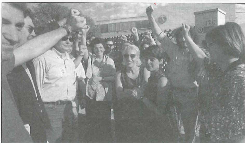
Il Comitato Politico Provinciale di Teramo del Prc davanti alla "Manuero 2000" di Nereto.